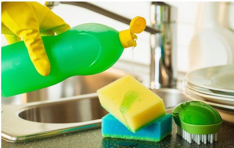
SABUN CUCI PIRING