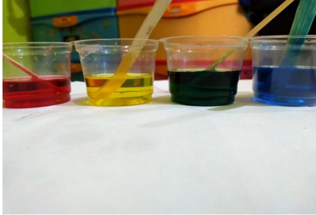
MADU , SABUN CUCI PIRING, AIR , MINYAK DITUANG KE DALAM GELAS KECIL YANG BERBEDA