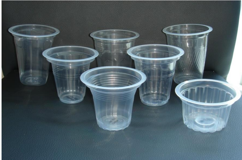
4-5 GELAS PLASTIK KECIL