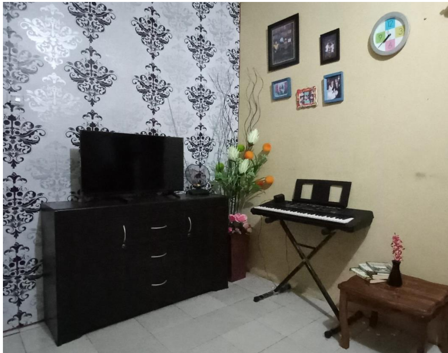
Gambar no. 2