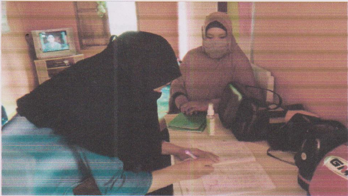
C. Metode: "Door to door" / Orang tua siswa C. Penutup

* Cara membuat tugas Narasi kepada siswa berdasarkan pengalaman belajar di sekolah.