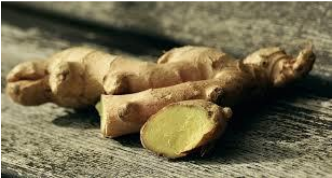
Jahe kuning/ putih