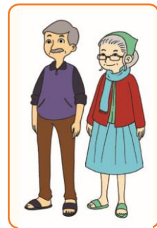
Kakek dan Nenek (Dewasa)