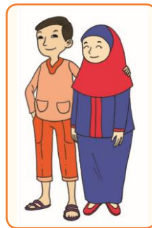
Ayah dan Ibu (Dewasa)