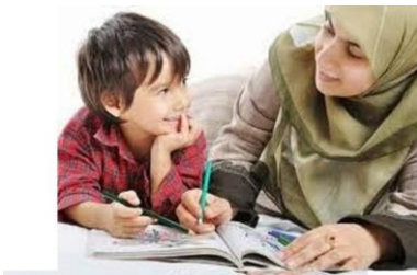
Contoh gambar ucapan terima kasih