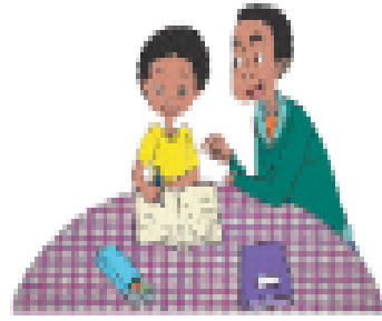
Contoh gambar permintaan tolong