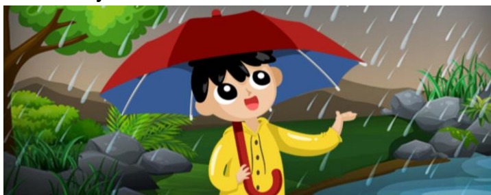
Bayu senang melihat hujan