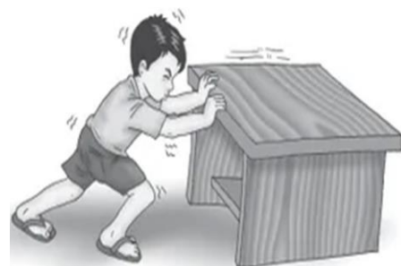
Gambar 2. Seseorang berusaha mendorong meja hingga bergeser