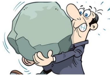
Gambar 4: Seseorang membawa batu tapi batu tidak berpindah

Pada gambar di atas, terdapat 4 kondisi yang berbeda. Berdasarkan pengamatan terhadap gambar di atas, identifikasilah gambar tersebut yang manakah gambar yang melakukan usaha atau tidak dengan mengisi tabel di bawah ini!