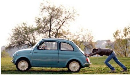
Gambar 3: Seseorang yang berusaha mendorong Mobil hingga mobil bergeser