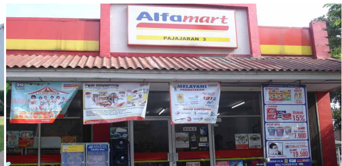
Perseroan Terbatas (PT)