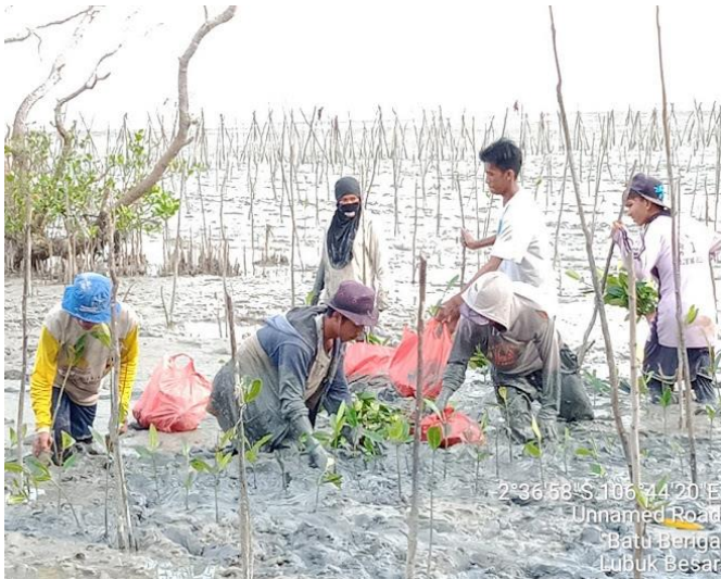
5. Penanaman Mangrove