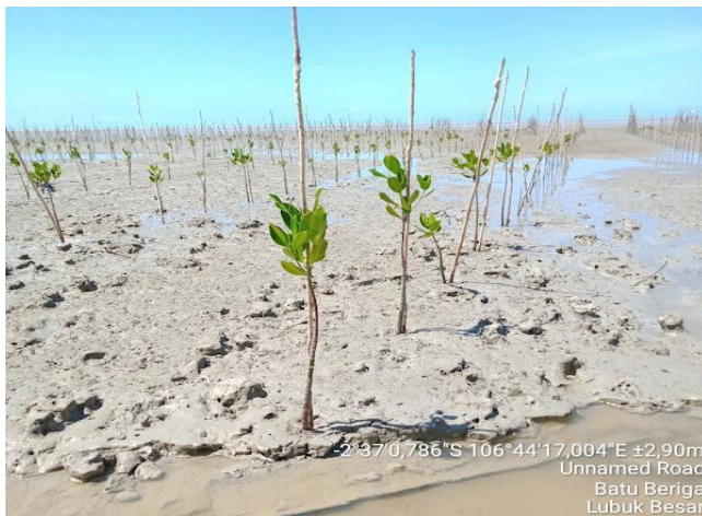
6. Penanaman Selesai