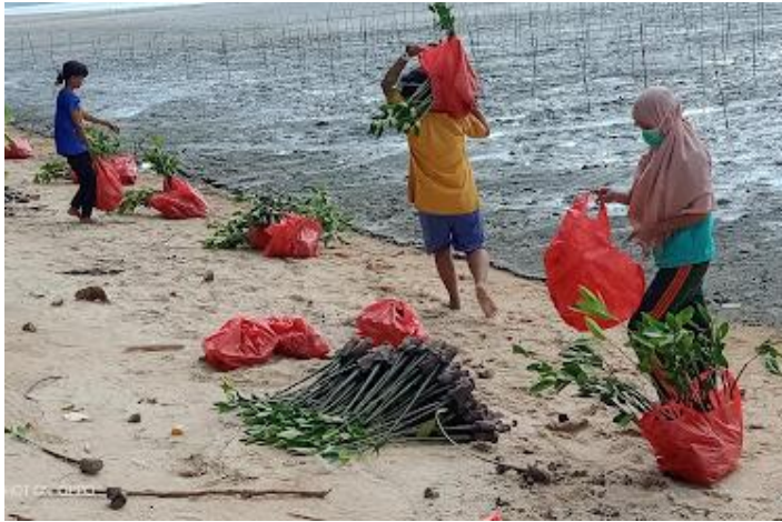
4. Pengangkutan bibit