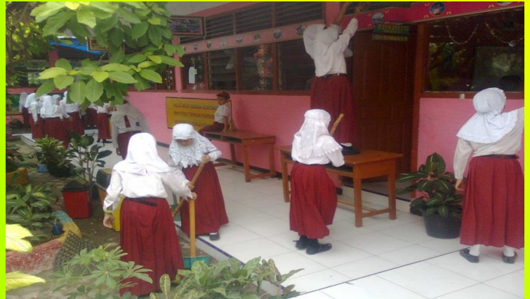
Gotong Royong Kelas