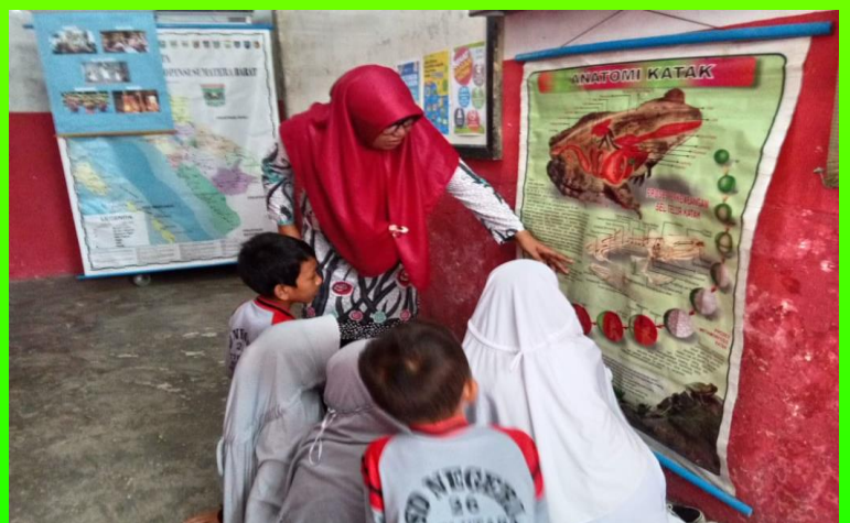
Pembelajaran di luar Kelas