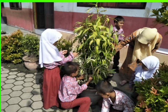
Lingkungan sebagai sumber belajar