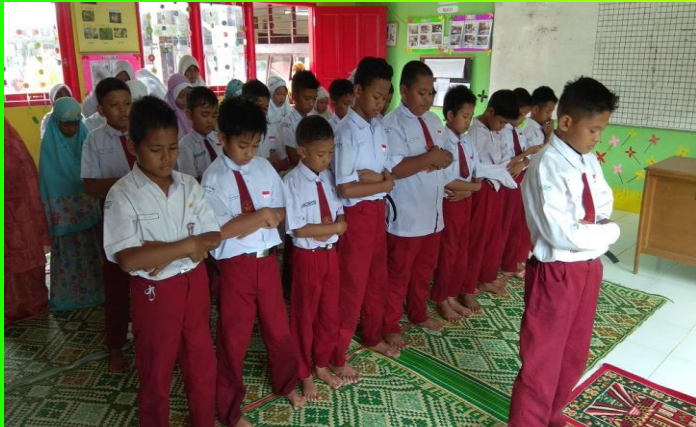
Sholat Dzuhur berjamaah