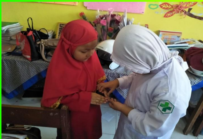
Kegiatan Dokter kecil