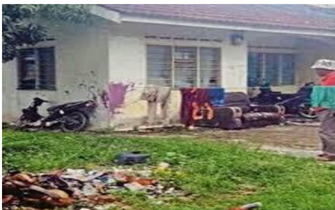
Gambar ke 2