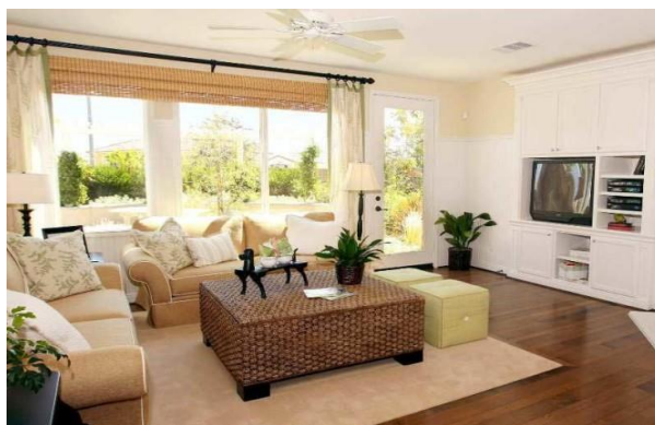
Gambar ke 1