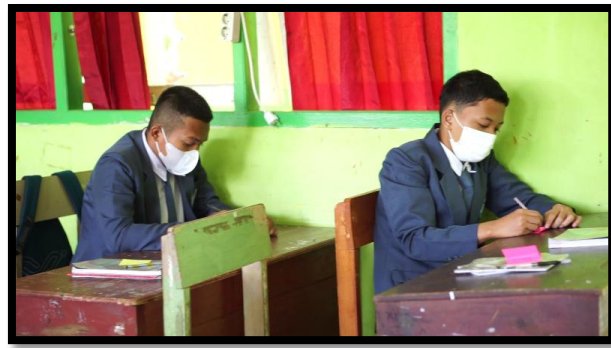
Gambar 4-9 Kegiatan Keyakinan Kelas. Di kelas X IPS 5