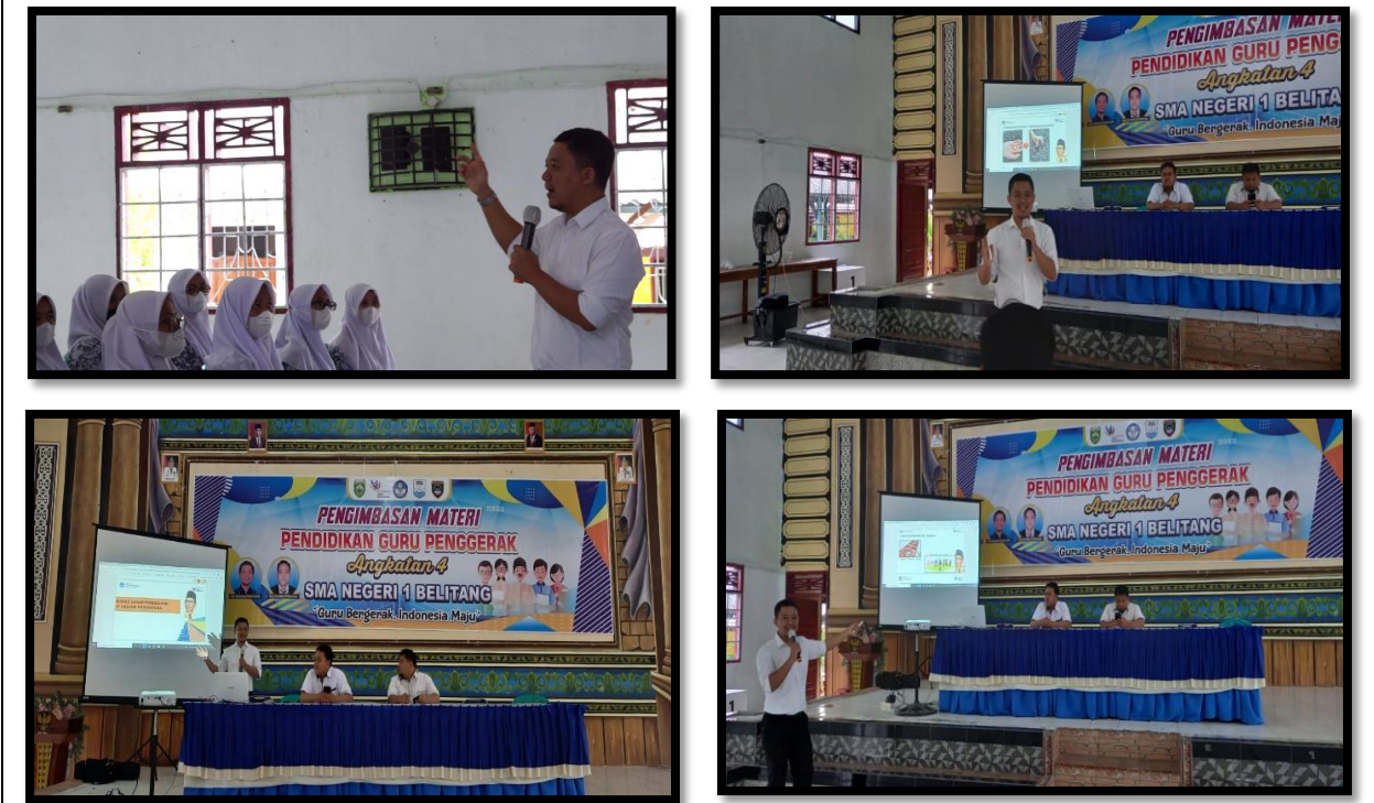
Gambar 10 – 15 Kegiatan Sosialisasi Profil Pelajar Pancasila di SMA N 1 Belitang