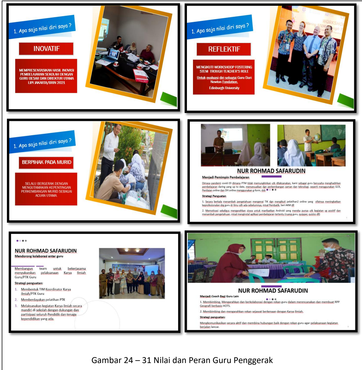
Gambar 24 – 31 Nilai dan Peran Guru Penggerak