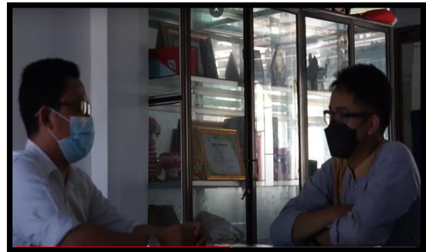
Gambar 22 – 23 Kegiatan Merestitusi Peserta didik (segitiga Restitusi)