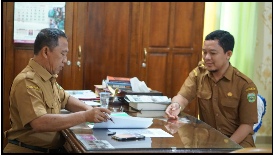
Gambar 2. Berkoordinasi Dengan Kepala Sekolah terkait Izin melakukan Aksi Nyata 1.4