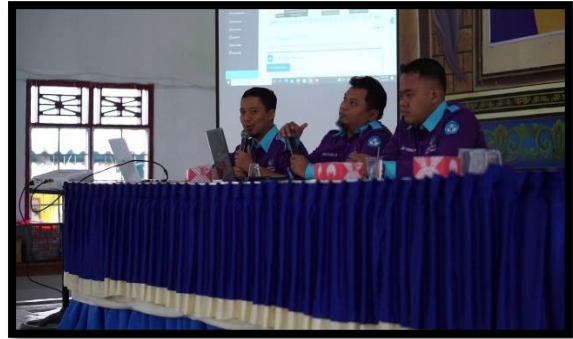
Gambar 16 – 21. Kegiatan sosialisasi dengan Dewan Guru Dan Tenaga Pendidikan tentang Modul 1.4