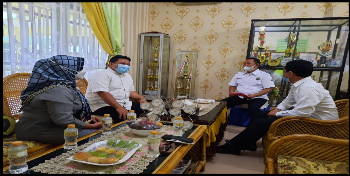
Gambar 1. Pelaksanaan koordinasi antara Kepala sekolah dan CGP serta Pengajar Praktek untuk persiapan Aksi Nyata 1.4