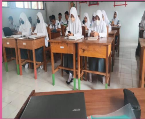
LITERASI AL QURAN PADA JAM PERTAMA