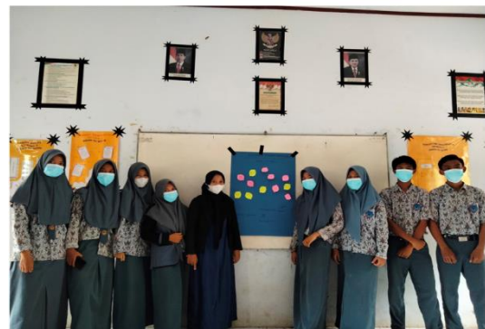
( PEMBUATAN KESEPAKATAN KELAS )