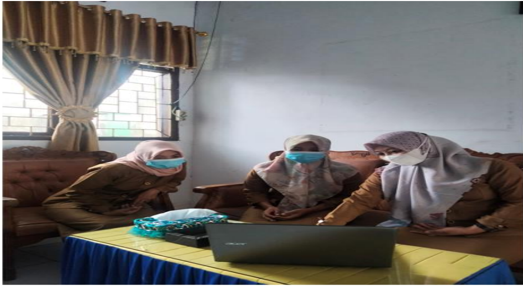
( SOSIALISASI KEPADA REKAN SEJAWAT )