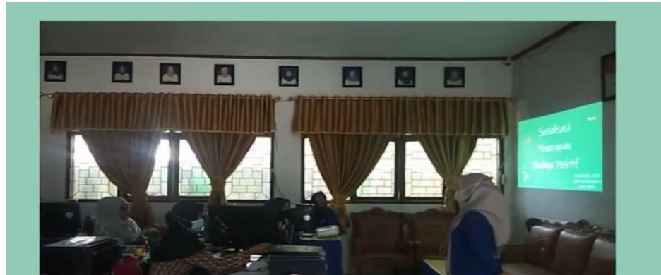
( PENGIMBASAN MATERI BUDAYA POSITIF )