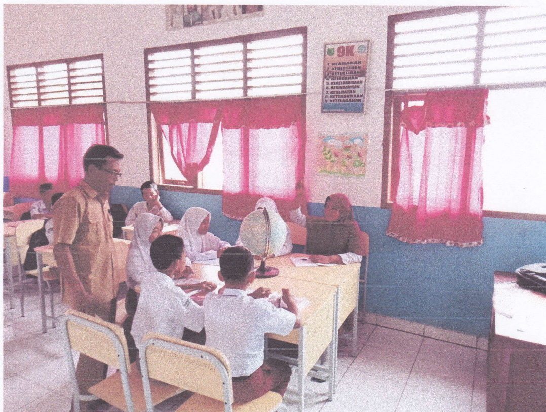
Gambar 2: Guru memberikan kesempatan pada setiap kelompok untuk berdiskusi