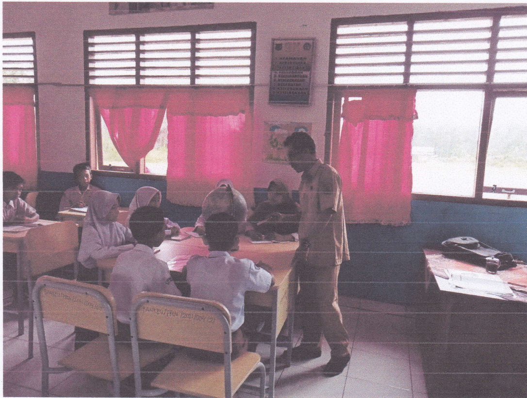
Gambar 1: Guru menjelaskan bagaimana perputaran Bumi