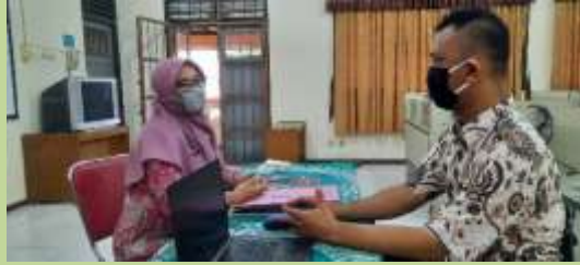
Berkolaborasi dengan rekan Guru BK