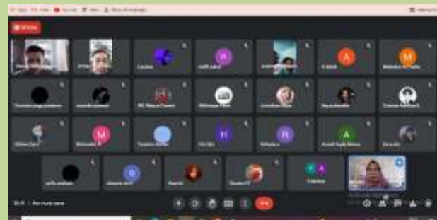
Dokumentasi Rapat Kelas