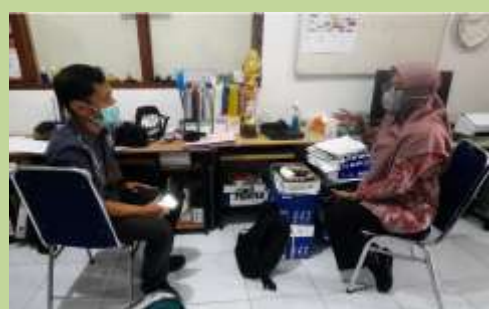
Mengkomunikasikan kegiatan dgn Ketua Komp.