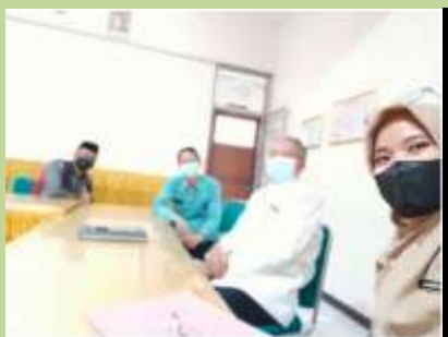
Mengkomunikasikan kegiatan dgn Kepala Sekolah