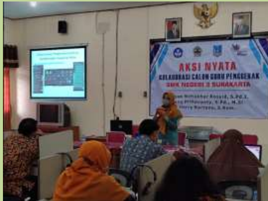
Menginformasikan aksi nyata keyakina kelas dengan rekan guru

Mengkomunikasikan dengan KS dan WKS1, mengajak BK untuk berkolaborasi, menginformasikan kepada guru mapel.