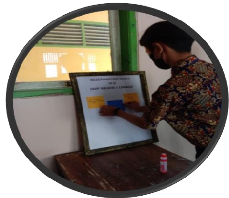
Hasil implementasi keyakinan kelas