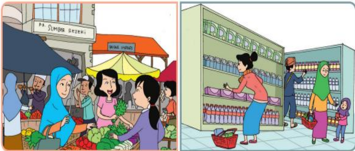
Kegiatan jual beli di pasar