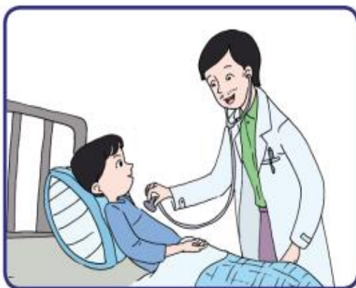
Dokter memeriksa pasien