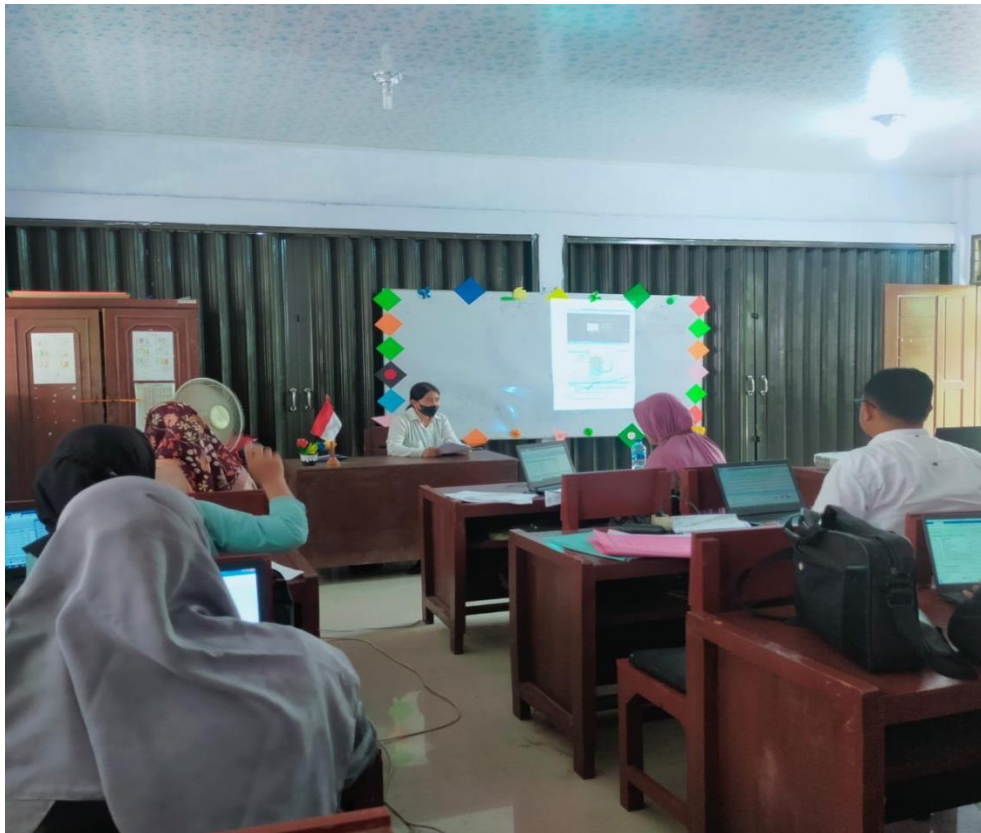
Sosialisasi dengan guru - guru

Dalam sebuah lingkungan pendidikan seperti SD Negeri 164522 Tebing Tinggi, menerapkan Budaya Positif merupakan tugas dari semua warga sekolah diantaranya Siswa dan Guru.