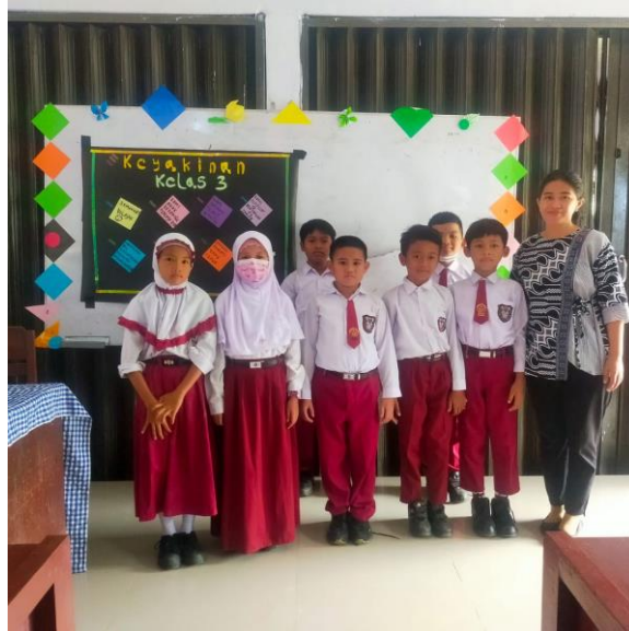
Sosialisasi kepada siswa melalui kesepakatan kelas

Kemudian membuat segitiga restitusi kepada murid kelas 3 SD Negeri 164522 Tebing Tinggi. Melalui restitusi, ketika murid berbuat salah, guru akan menanggapi dengan cara yang memungkinkan murid untuk membuat evaluasi internal tentang apa yang dapat mereka lakukan untuk memperbaiki kesalahan mereka dan mendapatkan kembali harga dirinya.