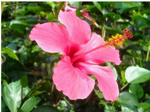
4. Merah Muda