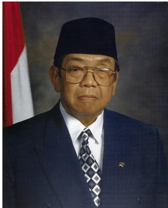
KH. Abdurrahman wahid