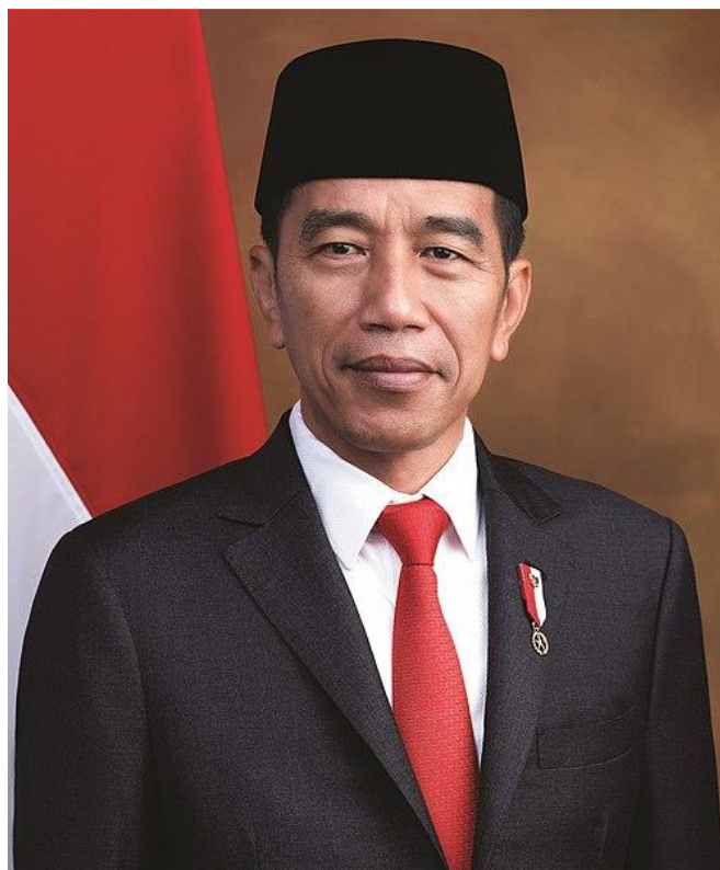
Ir. H. Joko Widodo

Sumber: https://id.wikipedia.org/wiki/B. J. Habibie