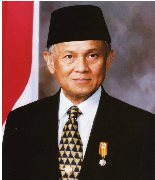
Prof. DR. Ing .B.J Habibie

Sumber: https://id.wikipedia.org/wiki/B. J. Habibie