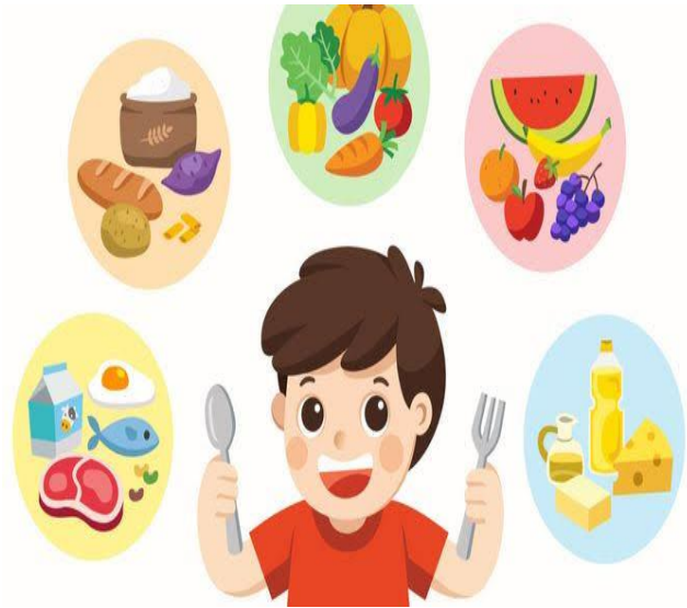
Iklan makanan sehat.