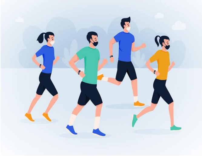
Iklan cara memelihara kesehatan tubuh.