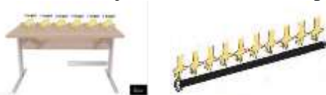
Gambar Ikat pinggang

Bandingkan panjang meja dengan panjang ikat pinggang.