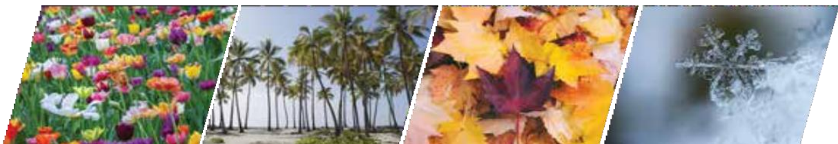
musim semi musim panas musim gugur musim dingin

2. Berdasarkan garis lintangnya, secara umum iklim yang dimiliki Amerika Serikat adalah beriklim subtropis, sedang, dan dingin yang mengakibatkan Amerika Serikat memiliki 4 musim. Apa yang kalian ketahui tentang 4 musim tersebut? Jelaskan!