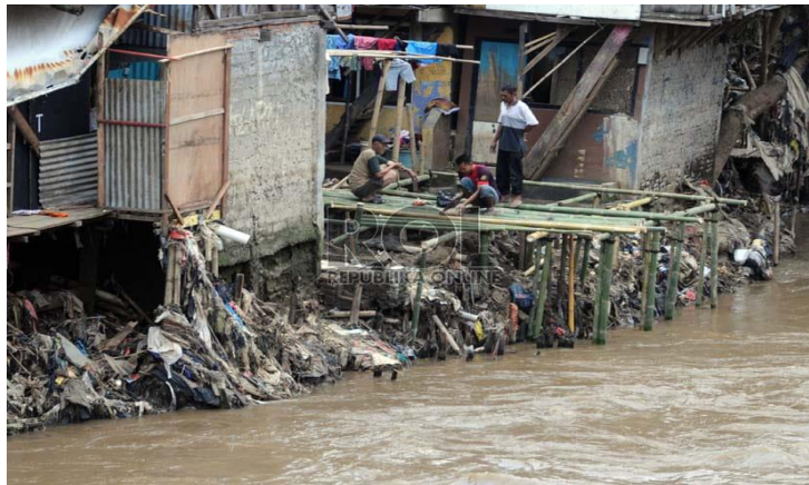
Rumah di bantaran kali