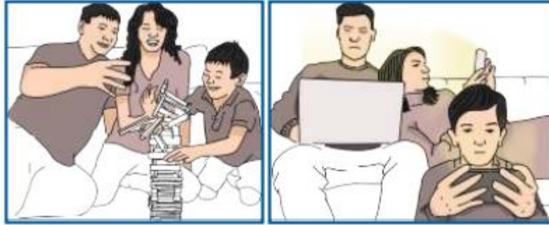
Kiri: Gambar individu yang sedang bercengkrama. Kanan: Gambar individu menggunakan smartphone .

Guru menayangkan konsep interaksi sosial manusia melalui tayangan video, gambar dengan tema dampak smartphone bagi siswa.