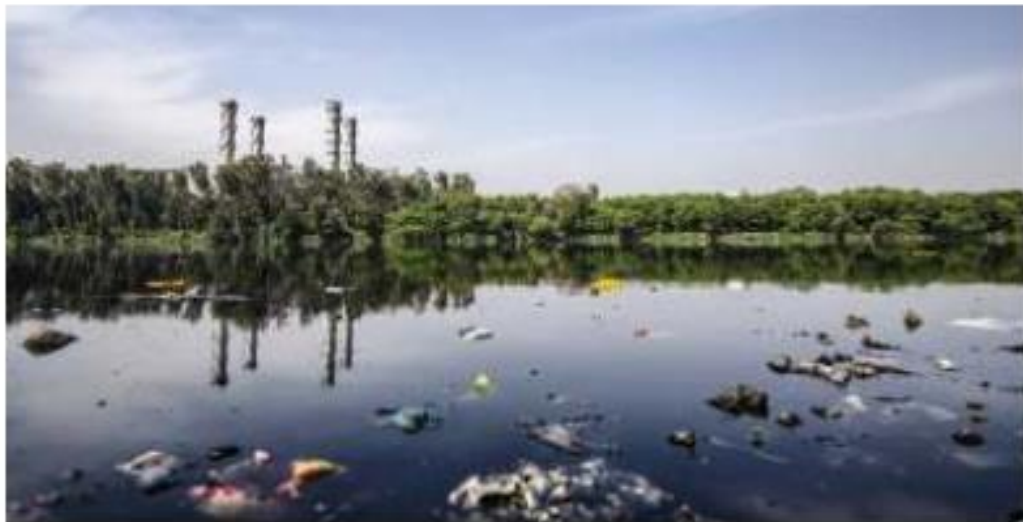
Gambar 2.5. Pencemaran air.

Guru menayangkan gambar/video pembentukan permukaan bumi dan pencemaran di muka bumi. Apersepsi dilakukan melalui tayangan video, gambar, buku, atau peribahasa dan lainnya sesuai dengan kondisi sekolah yang berkenaan dengan interaksi manusia dan lingkungan sekitar. Seperti contoh gambar di bawah ini.