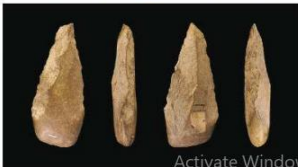
Kapak genggam.