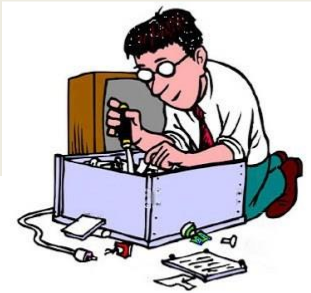
Ilustrasi Merakit Komputer

Satuan Pendidikan : SMKN Manonjaya Kelas/Semester : X/1 Tema : Merakit Komputer Sub Tema : Langkah-langkah Merakit Komputer Pembelajaran ke : 1 Alokasi Waktu : 2x45 menit