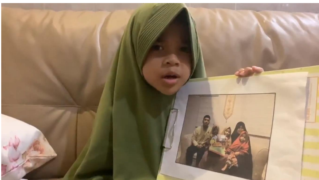
Perkenalan Anggota Keluarga