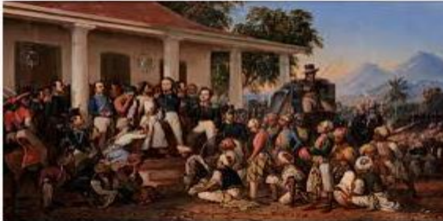
Penangkapan Pangeran Diponegoro - Wikipedia ...

Ceritakan dengan singkat gambar diatas :