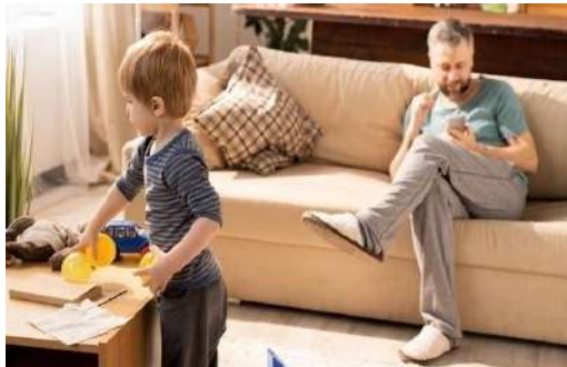
Orang tua lebih fokus pada Handphone . https://www.ibupedia.com/artikel/keluarga/5-dampak-negatif-gadget-orang-tua-terhadap-anak

3. Data collection (pengumpulan data) • Guru menayangkan gambar, dan peserta didik melakukan pengamatan tentang lembaga sosial. (melalui Google Classroom )