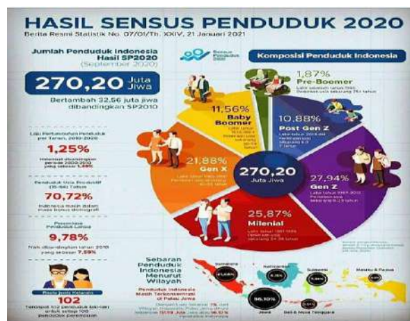
Sensus Jumlah Penduduk Tahun 2020. https://today.line.me/id/v2/article/LKqjQj