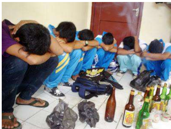
Kenakalan remaja.