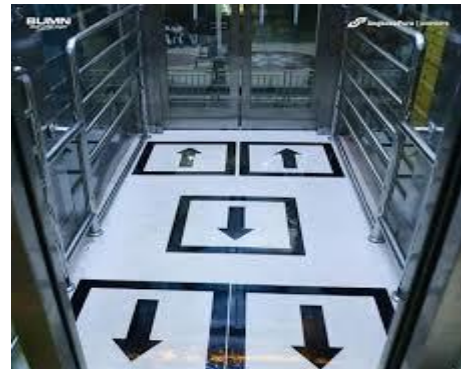
Gambar lift