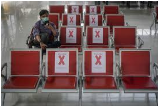
Gambar Tempat duduk