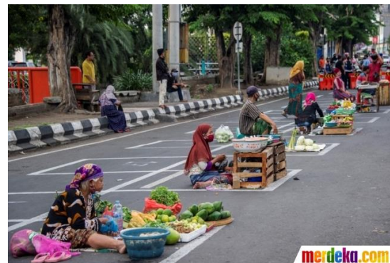
Gambar pasar tradisional

Apa yang dapat kamu analisis dari ke empat gambar tersebut apabila dikaitkan dengan tatanan hidup baru di era pandemi?