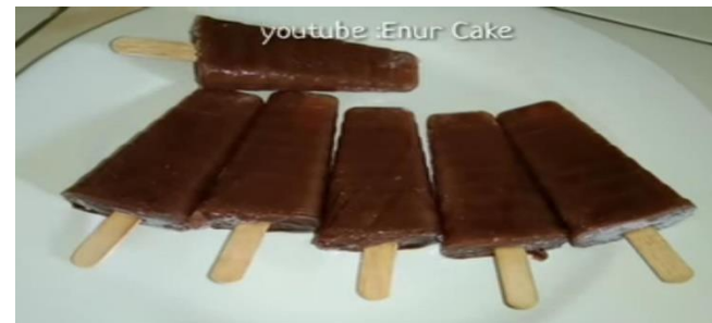
Es Krim siap dinikmati