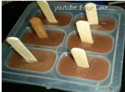
Tuang adonan es krim ke dalam