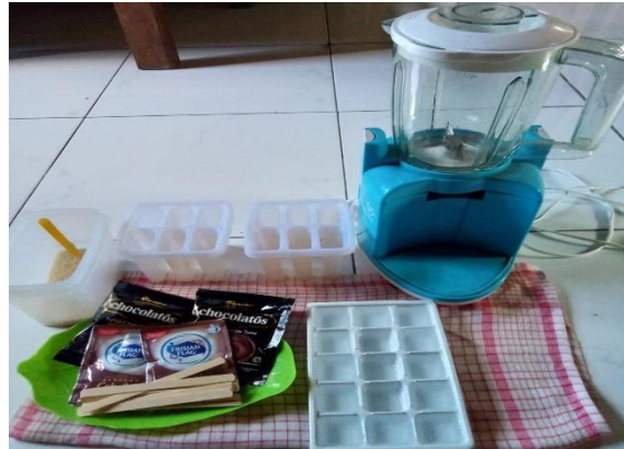
Alat da Bahan