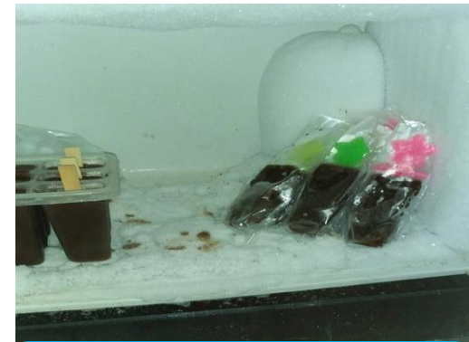
Simpan es krim ke dalam freezer