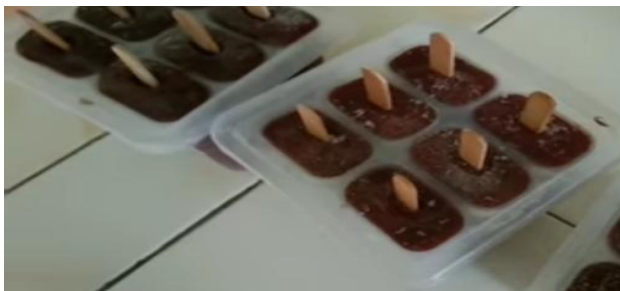
Es krim sudah beku