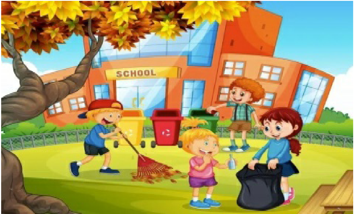
Gambar Kegiatan Membersihkan Halaman Sekolah