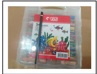
KERTAS GAMBAR DAN PENSIL