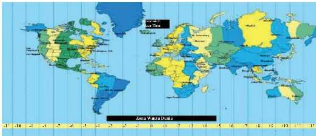
Gambar 1.1 zona waktu GMT

Coba perhatikan gambar di bawah ini ! pada gambar 1.1 adalah gambar zona waktu GMT ( Greenwich Meridian Time ) yang menjadi standar acuan waktu dunia. Jika di Greenwich pukul 00.00 pukul berapakah di jakarta ?