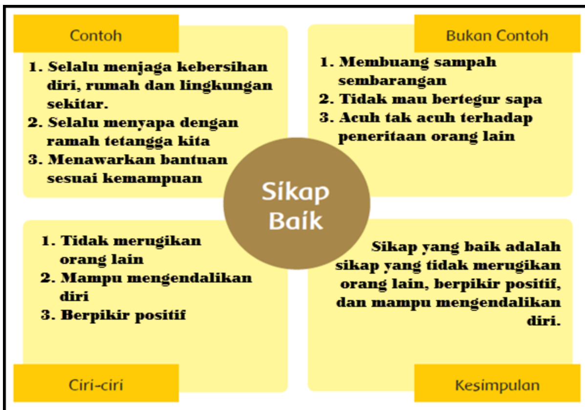
Contoh Diagram Sikap Baik dan Tidak Baik