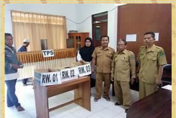
Gambar 1. Pemilihan Ketua RW

Amatilah gambar di samping dan sampaikan pendapatmu tentang bagaimana menjadi warga yang memiliki tanggung jawab dalam kegiatan yang tampak