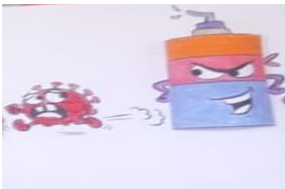
Foto virus corona