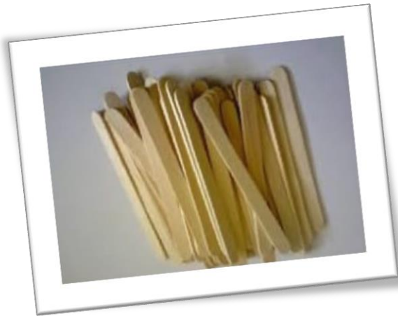
Stik es krim