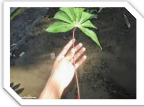
Tangkai daun ketela dan lidi