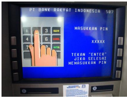
( Pin )