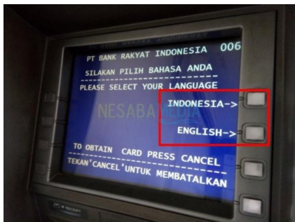
( language )