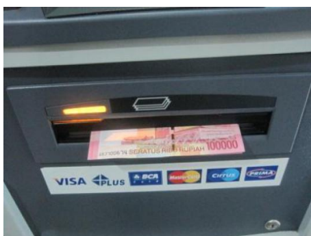
( money )