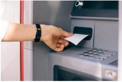
( receipt )