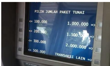
( amount )