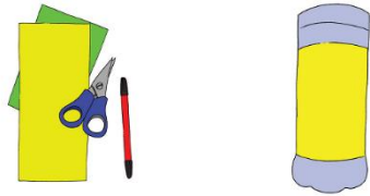
siapkan kertas untuk membalut dan ornamen lainnya

mistar, spidol atau pulpen, dan gunting untuk langkah ini. Gunakan lem tembak untuk merekatkannya pada botol, atau anda dapat menggunakan lem UHU atau sejenisnya.