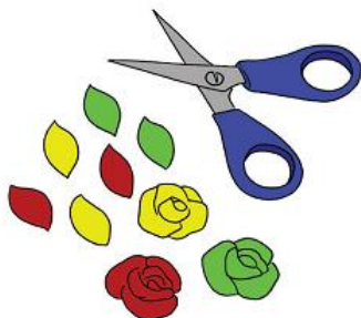
siapkan ornamen lainnya