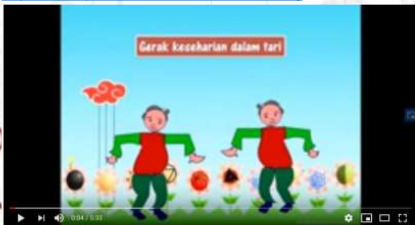
GERAKAN KESEHARIAN DALAM TARI SBdP kelas 2

https://www.youtube.com/watch?v=GEsizfHzAzg