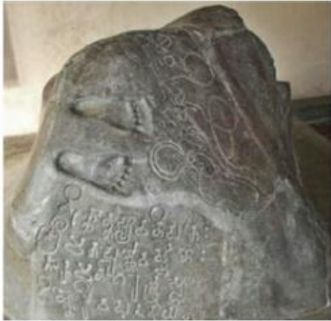
sumber: https://www.wisatamuseum.com , 29 Maret pk12.00

Raja Purnawarman sangat memperhatikan kesejahteraan rakyatnya. Ia memperbaiki aliran Sungai Gangga di daerah Cirebon. Dua tahun kemudian, ia juga memperbaiki dan memperindah alur Sungai Cupu sehingga air bisa mengalir ke seluruh kerajaan. Para petani senang karena ladang mereka mendapat air dari aliran sungai sehingga menjadi subur. Ladang para petani tidak kekeringan pada musim kemarau.