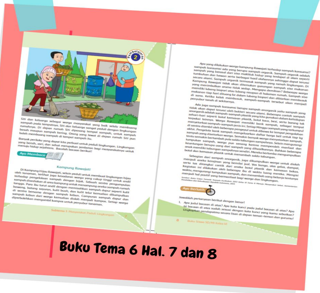
Buku Tema 6 Hal. 7 dan 8