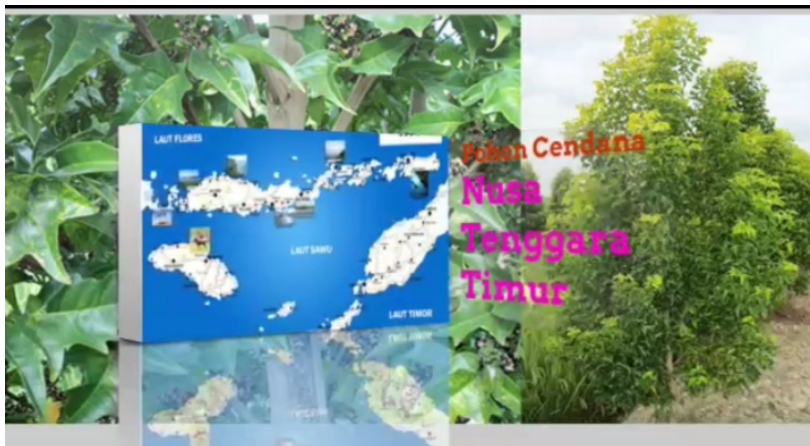
Pohon Cendana Nusa Tenggara Timur