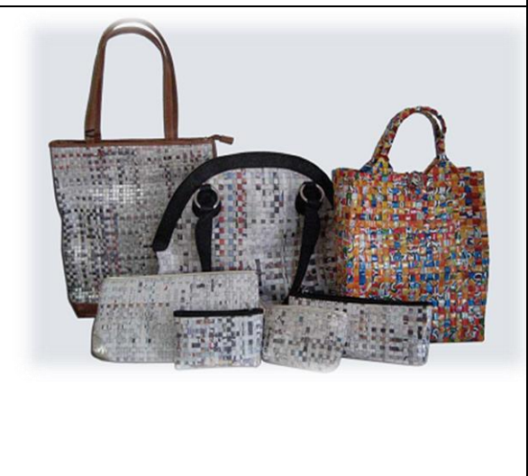
Gambar 6. Mendaur ulang bahan bekas menjadi tas