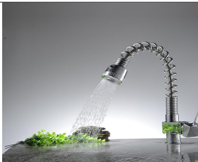
Gambar 5. Membuka keran air hingga air melimpah