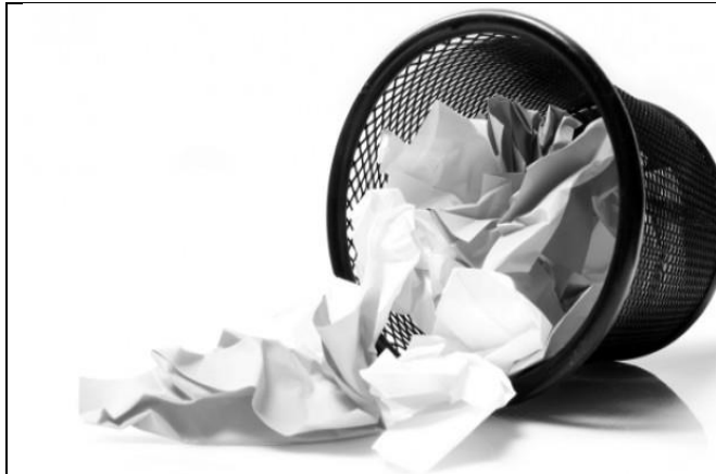
Gambar 3. Merobek-robek kertas