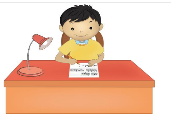
Gambar 2. Menggunakan kertas dengan baik