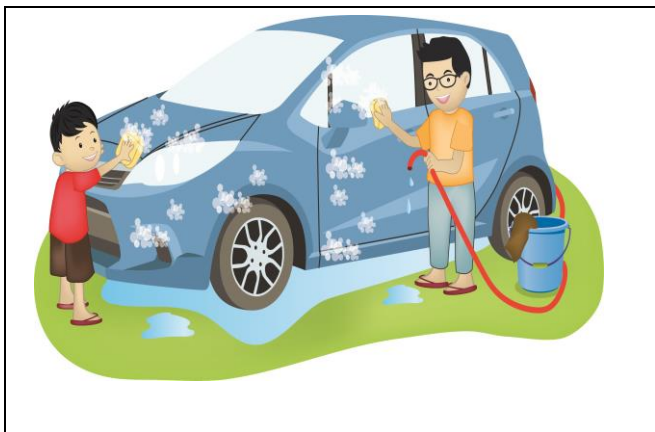
Gambar 1. Sedang mencuci mobil

Kelompokkanlah kegiatan berikut termasuk kegiatan yang menghemat penggunaan sumber daya alam atau kegiatan yang tidak menghemat penggunaan sumber daya alam dan berikan penjelasannya.