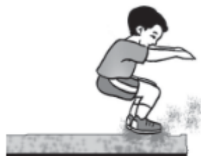
■ Gambar 1.19 Gerakan saat mendarat