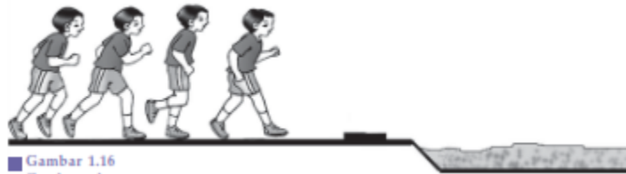
Gambar 1.16 Gerak awalan