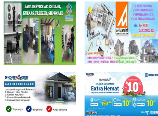
Gambar 1. Gambar Produk Barang.