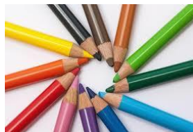
Pensil warna /krayon